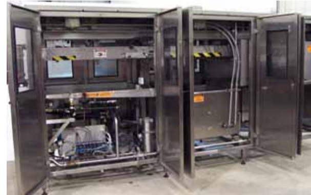
Mécanique facile d'accès et d'entretien