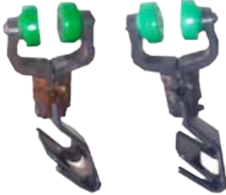
Crochets secteur volaille