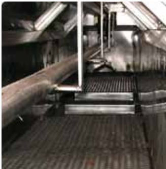
Protection des composantes ultrasoniques