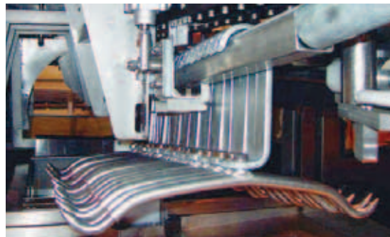
Zone d'accumulation de crochets