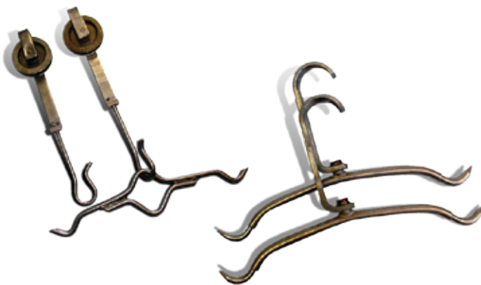
Crochets secteur porc/bœuf