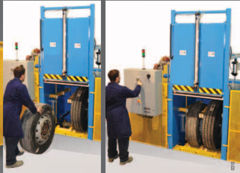
Équipement d'opération ergonomique demandant peu d'effort physique de la part des opérateurs