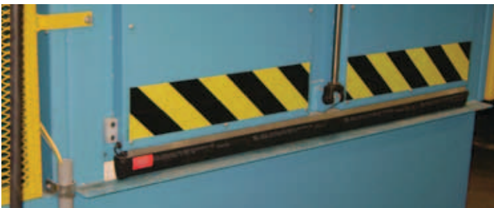
Composantes de sécurité pour une opération simple et sécuritaire