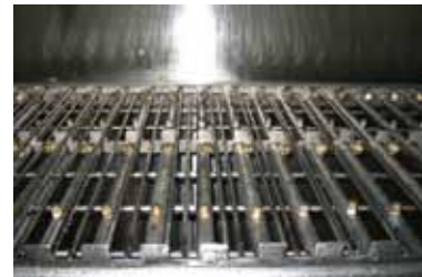
Composantes de pré-rinçage et de rinçage final à pression