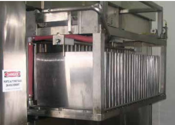
Chariots adaptés à la quantité de tôles lavées